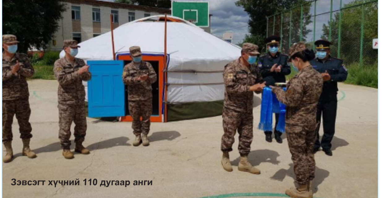
Зэвсэгт хүчний 110 дугаар анги

Ангийн удирдлага, ахлагчийн зөвлөл, Орхон аймгийн Засаг даргын тамгын газрын Цэргийн штабтай хамтран цэргийн алба хаагчдын нийгмийн асуудлыг шийдвэрлэх ажлын хүрээнд Зэвсэгт хүчний 110 дугаар ангийн Барилга угсралт засварын ротын