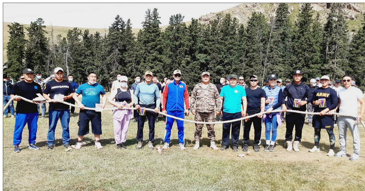
Зэвсэгт хүчний 016 дугаар нэгтгэл

Тус нэгтгэлд алба хааж буй хошууч цолтой бүрэлдэхүүний санаачилгаар 10 километрийн маршийг "Цол бүхэн сайхан" уриан дор Цэцээ гүний ноён оргил руу зохион байгуулж явууллаа.