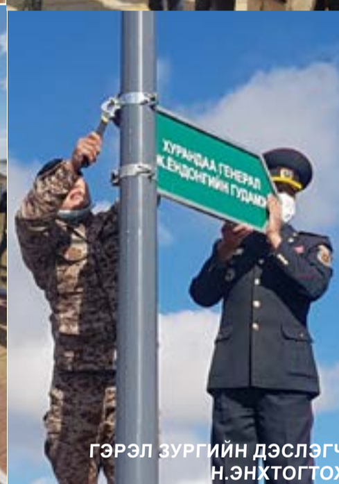
ХУРАНДАА ГЕНЕРАЛ Ж.ЁНДОНГИЙН ХӨШӨӨНИЙ НЭЭЛТИЙН ҮЙЛ АЖИЛЛАГААНЫ ГЭРЭЛ ЗУРГААС ...