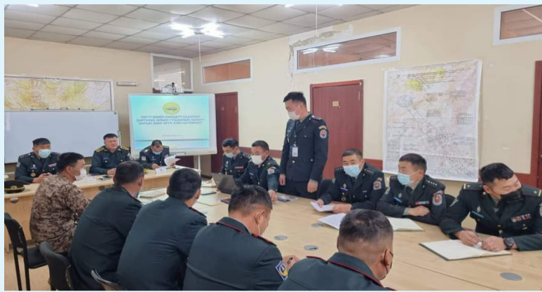
Зэвсэгт хүчний 016 дугаар нэгтгэл

2021-2022 оны сургуулийн жилийн нээлтийн үйл ажиллагаагаа зохион байгуулж нэгтгэлийн удирдлага, штабын офицерууд, салаа, салбарын захирагч нар болон даргалах албан тушаалын ахлагч нартай заах арга зүйн цугларалт явуулж байна. Энэ удаагийн цугларалт нь "Цэргийн сургалт бэлтгэлийг төлөвлөж, зохион байгуулахад албан тушаалтнуудын үүрэг оролцоо" сэдвийн хүрээнд "Цэргийн сургалт бэлтгэлийг төлөвлөх, удирдан зохион байгуулах үр чадварыг дээшлүүлж, багшлах бүрэлдэхүүний хичээл заах арга зүйг нэмэгдүүлэх" зорилготой юм. Заах арга зүйн цугларалт хоёр өдөр үргэлжилнэ.