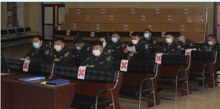
Зэвсэгт хүчний 167 дугаар анги