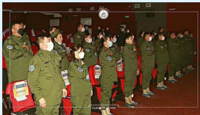
Баянзүрх дүүргийн хороодын Засаг дарга нарын ЗДТГ-ын Цэргийн штабаас дунд "Цэргийн бэлтгэл"

сургалт"-ыг энэ сарын 2, 3-ны өдрүүдэд зохион байгууллаа. Сургалтаар батлан хамгаалах бодлого, зорилт, үйл ажиллагааг танилцуулах, салбарын хууль тогтоомжийг орон нутагт сурталчлах, хэрэгжилтэд мэргэжлийн дэмжлэг үзүүлэх, иргэний цэргийн үр дүн биелэлтэд иргэд, байгууллага, хорооны оролцоог нэмэгдүүлж мөн төрийн батлан хамгаалах үйлчилгээг иргэдэд хүргэх хууль эрх зүйн мэдлэгийн хүрээг дээшлүүлэх зорилготой юм.